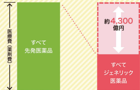
●ジェネリック医薬品の使用割合が100%となった場合の試算 ※2020年協会けんぽ試算

また、協会けんぽ加入者の皆さまがすべてジェネリック医薬品に切り替えた場合、約4,300億円の医療費適正化が見込めます。