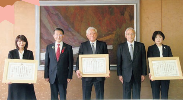
受賞事業所 表彰写真(令和4年10月12日 鳥取県庁にて)