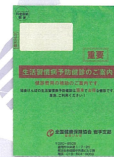
生活習慣病予防健診の案内 (イメージ)