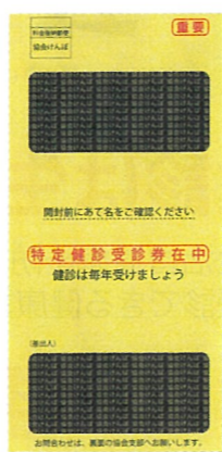
特定健診の案内(イメージ)