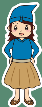
鶴飼さん 岐阜支部マスコットキャラクター

ビール……………中びん1本(500ml) 日本酒……………1合(180ml) チューハイ(7%)………350ml缶1本 ウイスキー……………ダブル水割り1杯 (原酒で60ml) ワイン……………2杯(240ml)