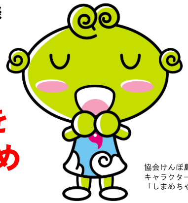
協会けんぽ島根支部 キャラクター 「しまめちゃん」