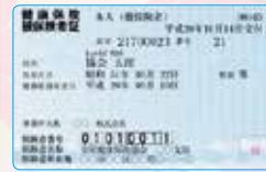
保険証は受診ごとにご提示を