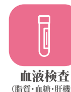
血液検査 (脂質・血糖・肝機能)