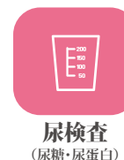
尿検査 (尿糖・尿蛋白)