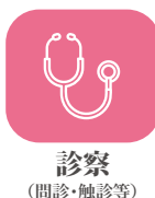
診察 (問診・触診等)