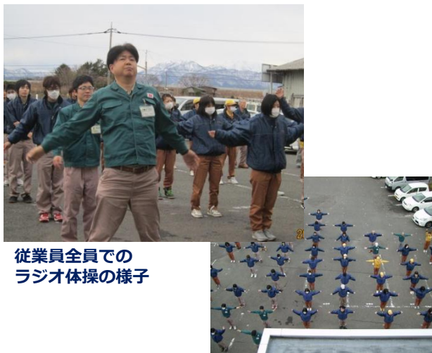
従業員全員でのラジオ体操の様子