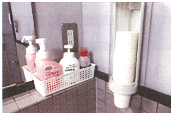
トイレには消毒液と、うがい用の紙コップも設置しています。