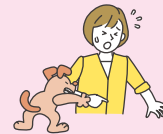
他人のペットに噛まれた等