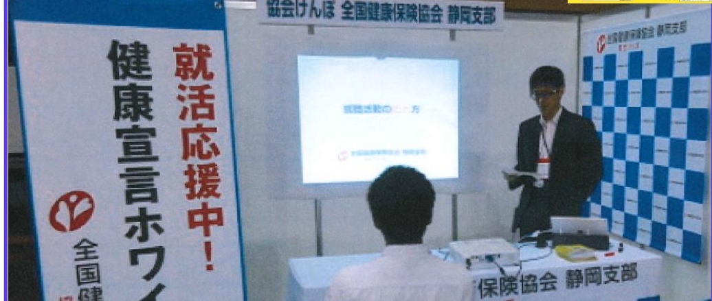
【就活セミナーにて健康経営ホワイト企業紹介ブースを開設】