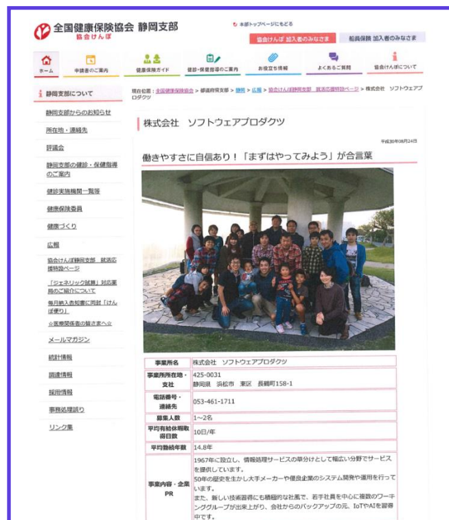
【協会けんぽホームページ 健康経営リクルート特設ページ】