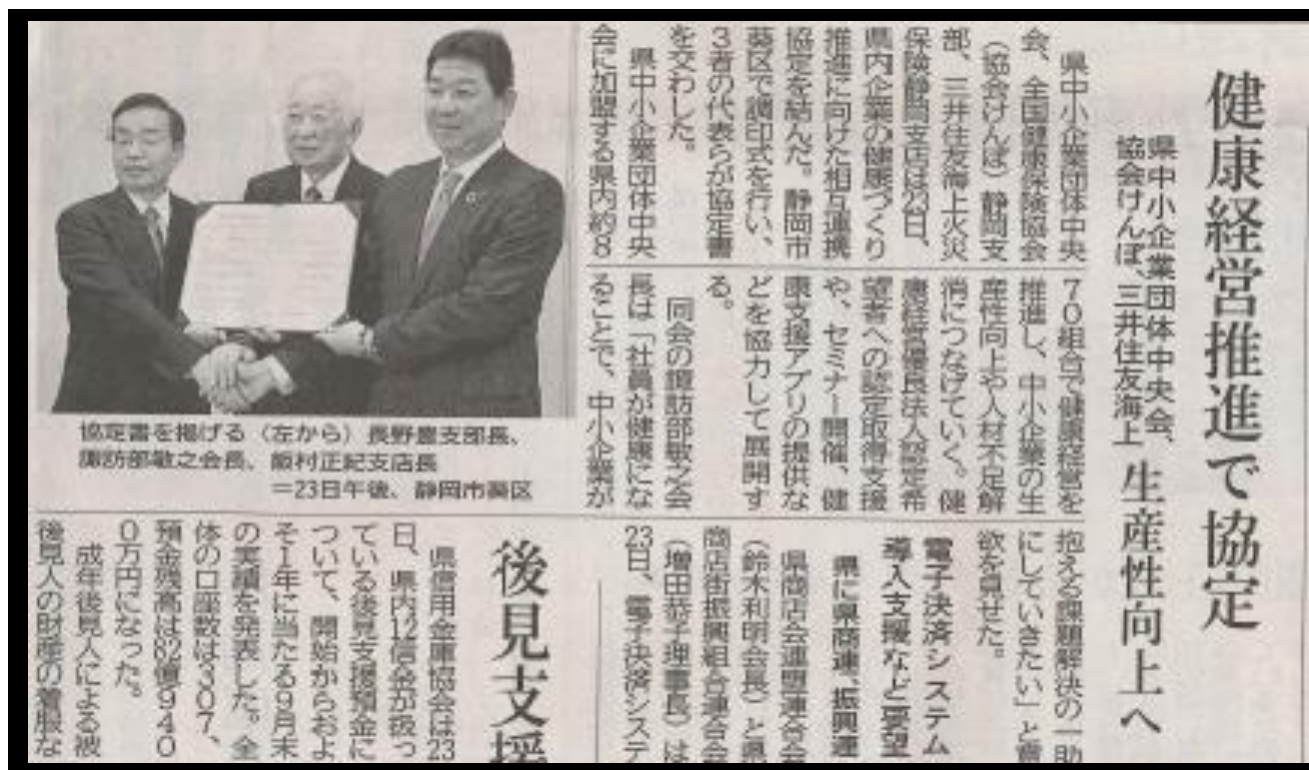
静岡新聞 平成30年10月24日朝刊8面

静岡県中小企業団体中央会は、約870の組合が加入しており、組合を通して業種ごとの企業への働きかけをおこなっていく。