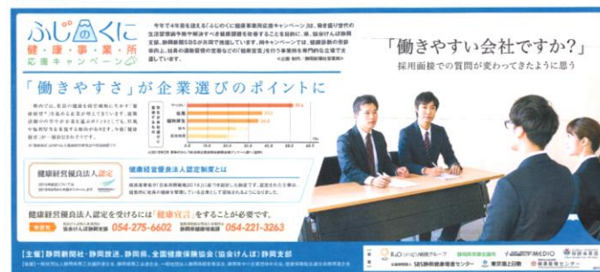
【平成30年9月2日静岡新聞広告】

就職活動中の学生へ向けて、健康経営に取り組む企業をホワイト企業として紹介。新聞での広告の実施、合同企業説明会において、ホームページ上の特設ページにリンクする紹介リーフレットを学生に配布