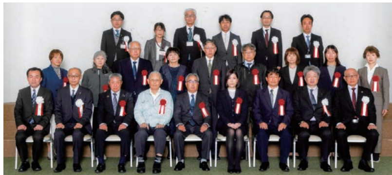
令和7年度 年金委員・健康保険委員功労者表彰式の集合写真