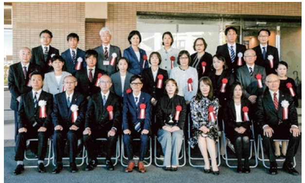
令和6年度 年金委員・健康保険委員功労者表彰式の集合写真