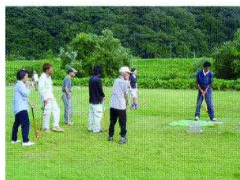
グラウンドゴルフ

所在地/安来市西赤江町741-3 会社概要/業種/総合建設業 設立年月日/昭和33年8月20日 従業員数/15名