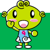
協会けんぽ島根支部キャラクター くしまめちゃん