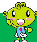
協会けんぽ島根支部キャラクター くしまめちゃん