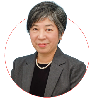
坂本 薫 教授 (学術博士)