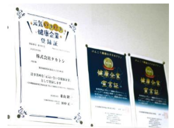
▲新潟県「元気いきいき健康企業」に登録