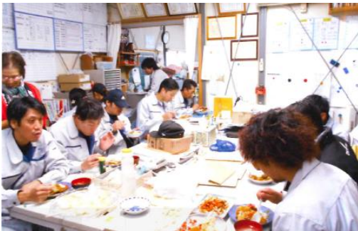
↑健康まつりの様子。会長特製のカレーライスが振るまわれました

社員の大半が、入社時や帰社時に甘味飲料を持参していました。職場の冷蔵庫内もジュース類が多かったのですが、取り組みメニューの掲示や朝礼等で周知したら、ほとんど見かけなくなりました。夏場は熱中症対策もあり、麦茶に塩を入れたものを冷やして準備しています。