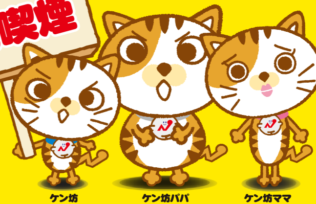
ケン坊 ケン坊パパ ケン坊ママ 協会けんぽ長崎支部キャラクター「尾まがり猫家族」