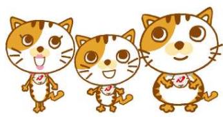
協会けんぽ長崎支部キャラクター 尾まがり猫家族

長崎支部【総合順位14位】 インセンティブ 0.01% 10.18% - 0.01% = 保険料率 10.17%