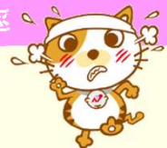
協会けんぽ長崎支部 キャラクター ケン坊ババ

健康保険料率の上昇を抑えるためにも、病気の予防・健康づくりに積極的に取り組んで、健康的な生活を手に入れましょう！