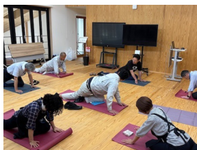
理学療法士による運動指導

健康経営の取り組みでは、外部から専門家を招いて開催する「健康経営セッション」に力を入れています。理学療法士を講師としたストレッチなどの運動指導、管理栄養士による生活習慣病の予防・改善を目的とした調理実習、認知症予防のレクチャー、歯周病と全身の健康を学ぶセミナーなど、さまざまな角度で健康づくりに役立つ講座やワークショップを開催。また、初級、中級、上級編と3パターンある健康増進体操を社内で開催・推奨しています。さらに、その効果について、社内の測定室で筋肉量や体脂肪率などの数値を計測し、専門家が各自にフィードバックしています。社員には万歩計を支給し、チームで歩数を競い合う仕組みを取り入れるなど、運動習慣づくりを推進しています。