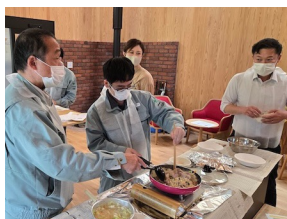
調理実習は社員交流の場にも