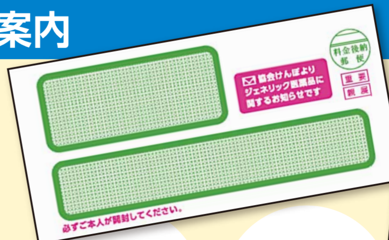
ジェネリック医薬品に関する「お知らせ」の封筒のサンプル