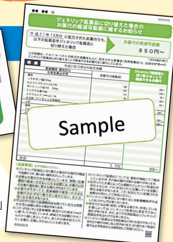
ジェネリック医薬品に関する「お知らせ」のサンプル