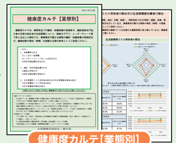
健康度カルテ【業態別】