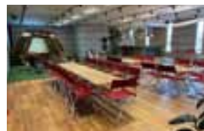
アウトドア志向のコワーキングスペース

社内にコワーキングスペース・シェアオフィスを開設し、人の交流を促すとともに、アウトドア志向のオフィスで新しい発想が生まれやすい環境の整備に取り組んでいます。