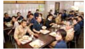
担当社員の手作り昼食を食べている様子

またシオノ鑄工には本格的な厨房設備があり、毎日、社員に手作り給食を提供しています。もともとは、菓子パンやカップラーメンばかり食べている社員がいるのを先代の社長夫人が気にかけて、事務所を拡張して厨房を作り、始めました。今では現社長夫人が引継ぎ、社員も増えてきたので、もう1人調理担当の社員を増員して、2人体制で給食の提供をしています。健康を考え、毎回20品目以上の食材を使ったメニューを提供しています。