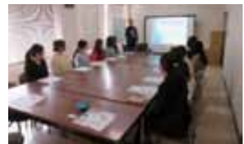
協会けんぽの健康講座を開催している様子