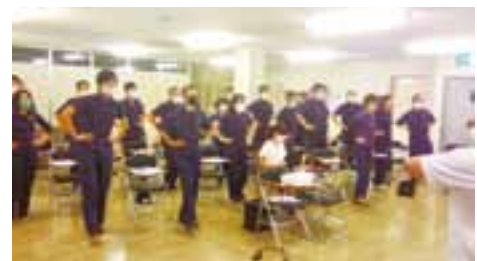
協会けんぽの健康講座を開催している様子

当社は社員の皆さんの健康があって事業運営が成り立っているという事を大切に考え、まずは協会けんぽ様の「京(きょう)から取り組む健康事業所宣言」にトライし、ステップアップとして健康経営優良法人の取組みにもチャレンジしています。その中の取組みとして、綾部市のあやちゃん健康ポイントへの参加や、始業前のラジオ体操の取組みなどを行っていますが、今回協会けんぽ様より、健康講座の機会をいただきましたので、講師に来ていただき、本気のラジオ体操について勉強する機会を得ることができました。今まで当たり前に行っていたラジオ体操ですが、実際にひとつひとつの動きに意味があり、動かすべき部位がどこなのかポイントを教えてもらったことで、ラジオ体操第一をきちんと行くと、汗をかく位の運動になる事を学ぶ事ができました。今回の学びを契機に始業前のラジオ体操をしっかり行い準備運動をすることで、仕事中のケガの予防などにつなげたいと思っています。また、このような機会を活かさせていただきながら、社員の皆さんの健康につながる情報提供や取り組みを積極的に行っていきたいと思っています。