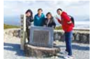
SNSにアップされた休暇の様子

シオノ鑄工では有給休暇の取得が義務化される前からリフレッシュ休暇制度を導入し、年1回は5連休となるよう休暇を取り、休暇中は心身ともにリフレッシュできるよう、旅行やレジャーにかかった費用に対し最大5万円のリフレッシュ手当を支給するなどの支援をしています。