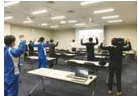
DKS 体操 (DKS EXERCISE) 風景

『人は財産であり、人を大切にする』の思想のもと、従業員の健康と向き合っており、今後も従業員一人ひとりの健康づくりを支援してまいります。