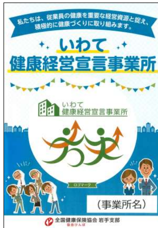
〈 ロゴマークポスター 〉