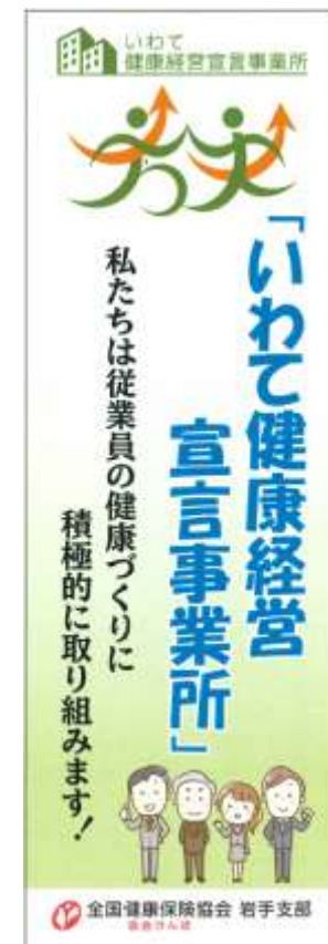
〈 健康経営宣言ミニのぼり 〉