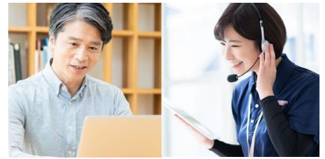
ZoomおよびZoom(ロゴ)は、Zoom Video Communications, Inc. の米国およびその他の国における登録商標または商標です。

保健師・看護師・管理栄養士などの有資格者が、3か月間あなた専属で担当します。ご自身の状況に応じて、無理なく続けられる生活習慣改善プランをご提案します。面談は全てオンライン会議ツール「Zoom」を利用するため、ご家庭からゆったりご参加いただけます。※Zoom面談は、積極的支援3回・動機付け支援2回のみ