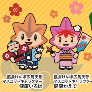
協会けんぽ広島支部 マスコットキャラクター 健康いろは