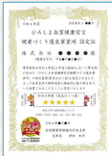
令和4年度 健康づくり優良事業所認定証 (イメージ)