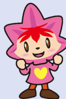
協会けんぽ広島支部 マスコットキャラクター 健康 かえで