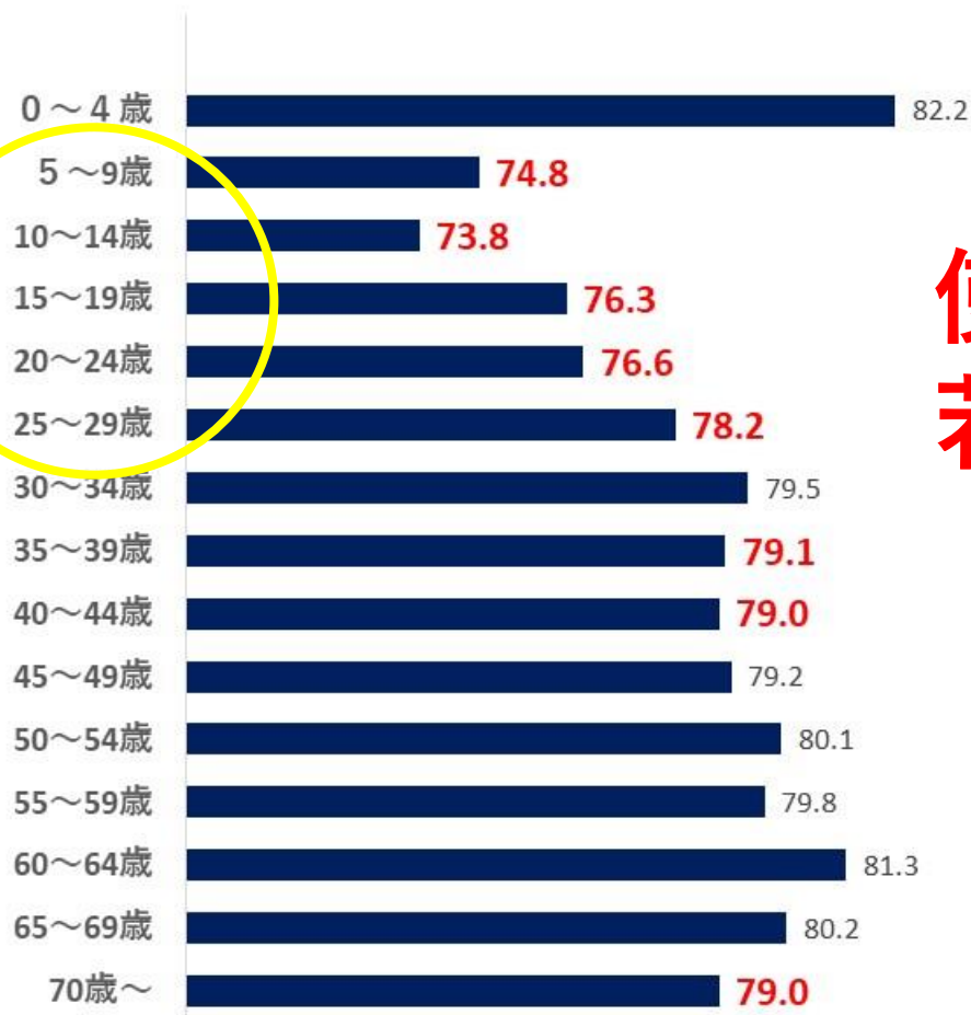
年齢別ジェネリック使用割合（令和2年2月）