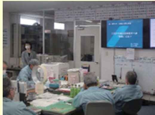
健康セミナー受講の様子