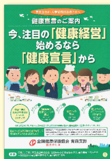
「健康宣言のご案内」

詳しくは、令和2年度「生活習慣病予防健診」のご案内に同封の、パンフレットをご確認ください