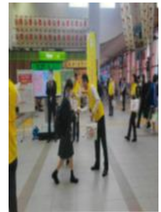
世界禁煙デー街頭キャンペーンの様子

世界禁煙デー秋田フォーラム、受動喫煙防止フォーラム等の共催や県内各種イベントへ参画し啓発活動を実施。