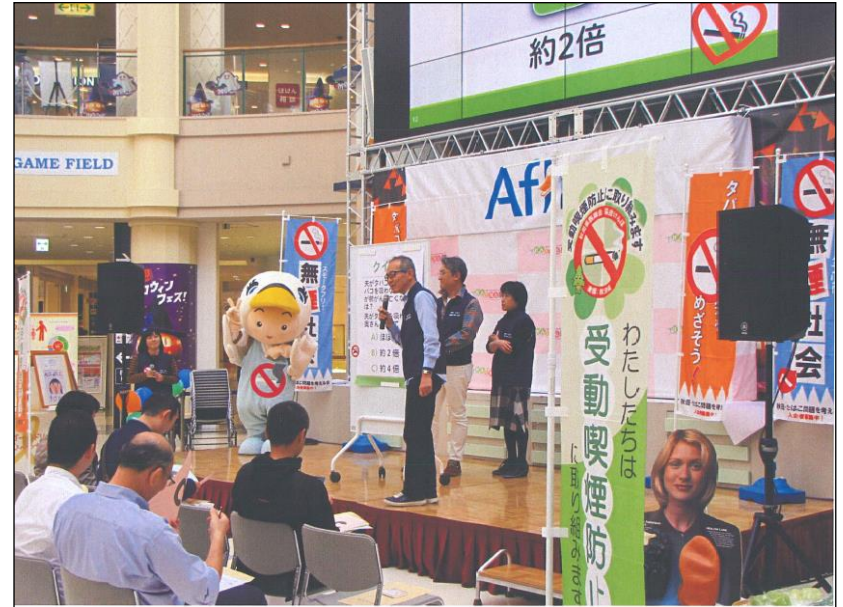
( 受動喫煙防止フォーラム )