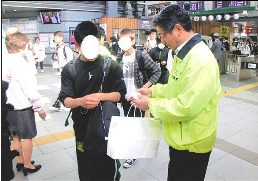
( 世界禁煙デー街頭キャンペーン )