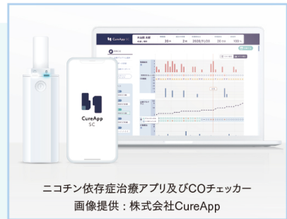
ニコチン依存症治療アプリ及びCOチェッカー

禁煙外来はすべての医療機関で行っているわけではありませんので、「禁煙外来 秋田県」で検索して事前に確認をお願いします。