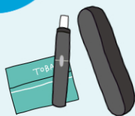
可視化した加熱式タバコ喫煙者の呼気