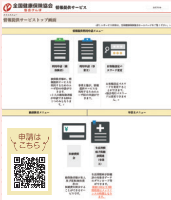
【情報提供サービストップ画面イメージ】

健診実施機関へ生活習慣病予防健診(35歳以上の被保険者様の健診)の申込みをする際、健診申込者の一覧をデータで求められることがあります。そんな時には、協会けんぽのホームページ上にある「情報提供サービス」から健診対象者一覧データ(CSVファイル)をダウンロードすることが可能です。