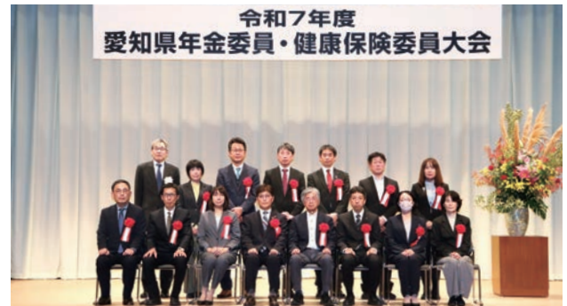
令和7年11月11日(火)中電ホールにて