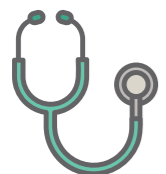
診察 (問診・触診等)

特定健診は協会けんぽが 全額補助 を行います。 様々な項目で健康状態をチェックでき、 生活習慣改善 のきっかけとなります。