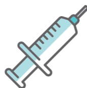
血液検査 (脂質・血糖・肝機能)