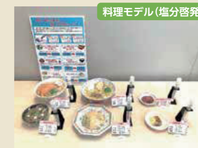
料理モデル(塩分啓発)