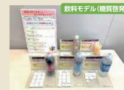
飲料モデル(糖質啓発)