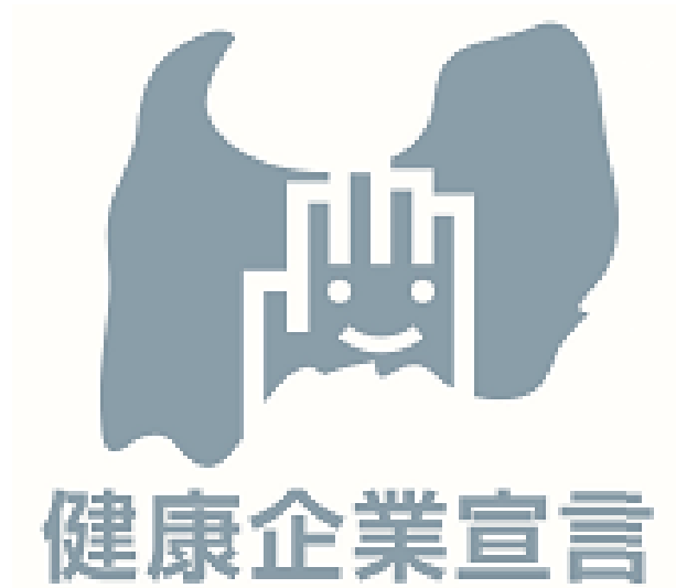
B Step1認定事業所ロゴマーク