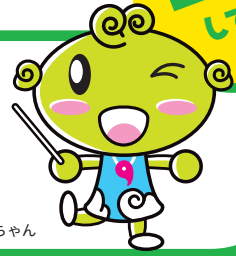
協会けんぽ島根支部 キャラクター しまめちゃん