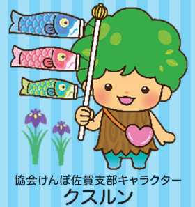
協会けんぽ佐賀支部キャラクター クスルン