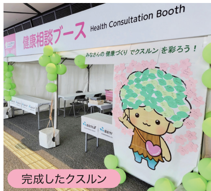
完成したクスルン