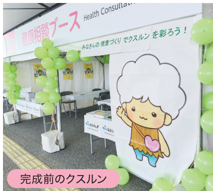
完成前のクスルン

3月22日(日)開催のさが桜マラソンに健康イベントブースを出展しました。イベントの中でご来場いただいた皆さまには、健康づくり目標を葉や桜のメモに書いて、協会けんぽ佐賀支部キャラクター「クスルン」へ貼付いただきました。多数の皆さまの健康づくりへの想いが集まったことにより、彩り豊かで素敵な「クスルン」を完成させることができました。ご来場いただいた皆さま、ありがとうございました!