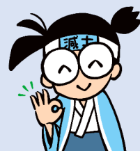
協会けんぽ岡山キャラクター減士 (へるしー) くん