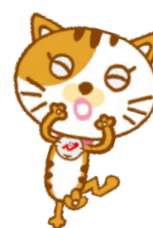
長崎支部キャラクター ケン坊ママ