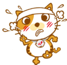
長崎支部キャラクター ケン坊パパ