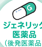
ジェネリック医薬品 (後発医薬品)

◆先発医薬品と効き目・安全性が同等 ◆開発費用が抑えられるため価格が安い 薬によっては約 6割 もおトク!