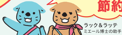
ラク&ラッテ ミエール博士の助手