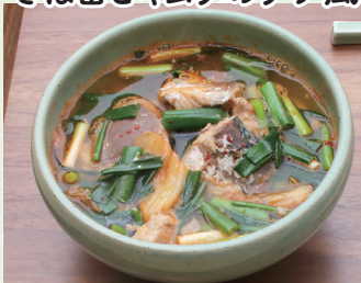
さば缶とキムチのチゲ風

「きょうの料理」でおなじみの 後藤アナウンサーと、人気管 理栄養士の藤井先生との軽快 なトークが魅力の動画です！