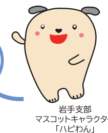
岩手支部 マスコットキャラクター 「ハビわん」

令和8年度の受診券はご確認いただけましたか? 特定健診を受けるなら「市町村の集団健診」がおすすめです!