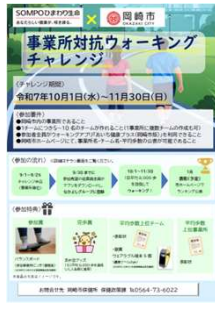
令和7年度配信チラシ